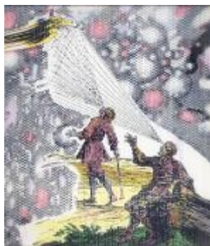
Sigmar Polke Beyond the rainbow , 2007

La mayoría de sus obras trataron temas políticos e históricos y en ellas intentó denunciar la manipulación de los medios de comunicación. Utilizó elementos de la pintura moderna pero también otros de la cultura de masas, como lo kitsch o la publicidad.