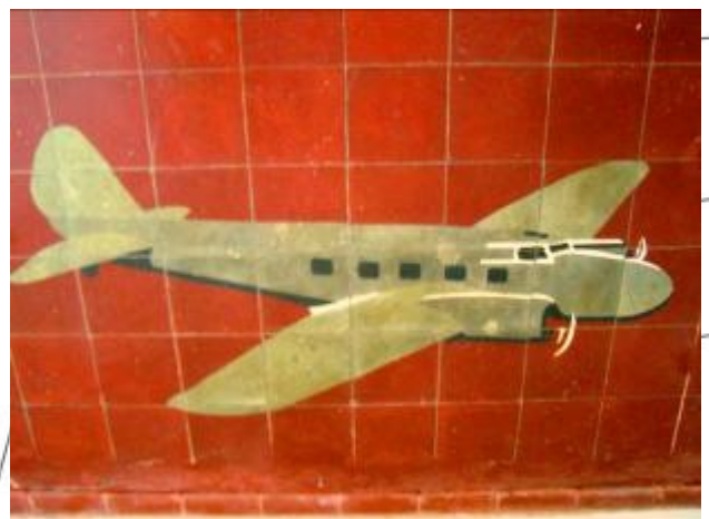
Este fue el mosaico que se encontró y se decidió restaurarlo y dejarlo como testigo arquitectónico.

Pero ese no es el único avión representado en el aeropuerto de La Sabana: en el mural del Salón Dorado y en la placa conmemorativa de la administración Cortés aparecen otros aviones.