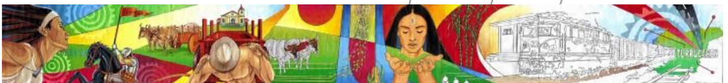
Maqueta del mural cortesía de Raúl Cháves