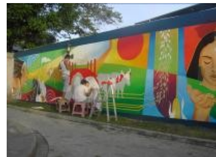
Diferentes etapas de la realización del mural.