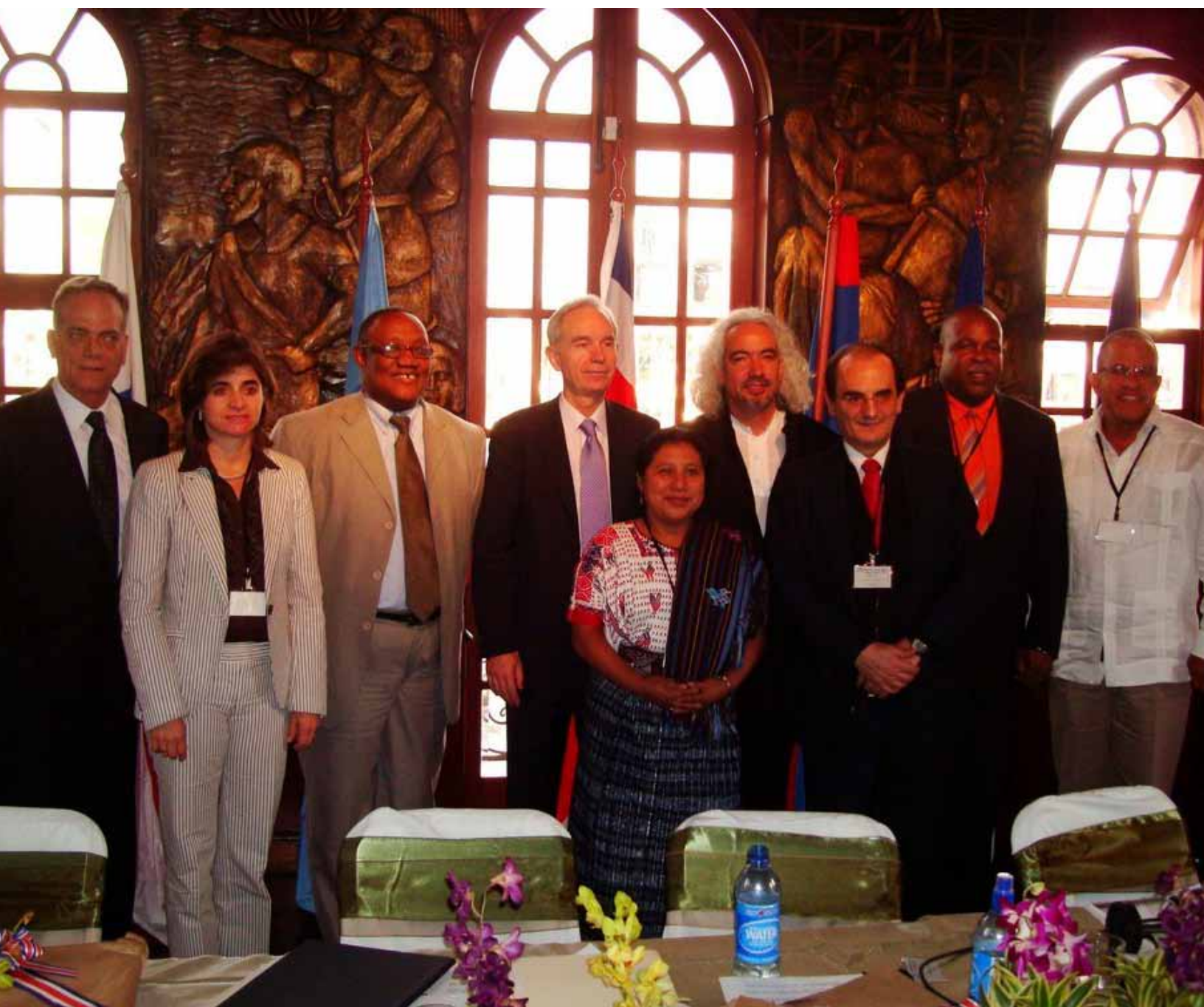
Ministros participantes en torno al Corredor Cultural Caribe: 24 de Enero de 2011

El Corredor Cultural Caribe cuenta con la asistencia técnica de la Organización de las Naciones Unidas para la Educación, la Ciencia y la Cultura (UNESCO) y se enmarca en el interés manifiesto en la II Reunión Extraordinaria del Consejo de Autoridades de Cultura de la CECC/SICA, el 5 de noviembre del 2010, en El Salvador.