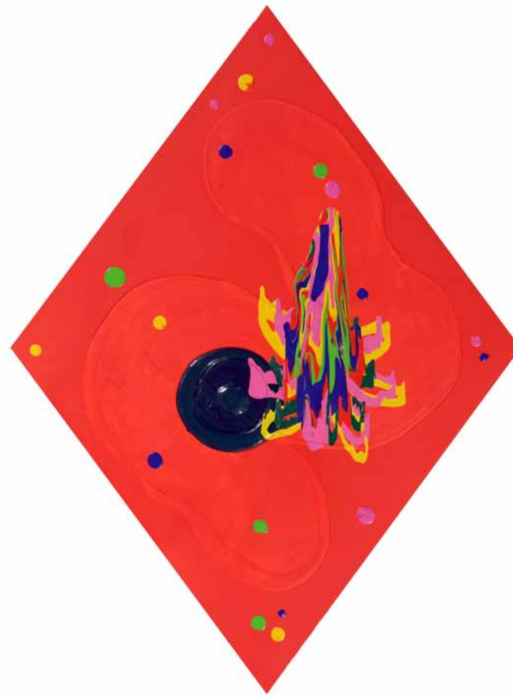
Mario Maffioli R. TENSIÓN Y ESPACIO, 2011. Acrílico sobre tela. 175 x 134 cm.